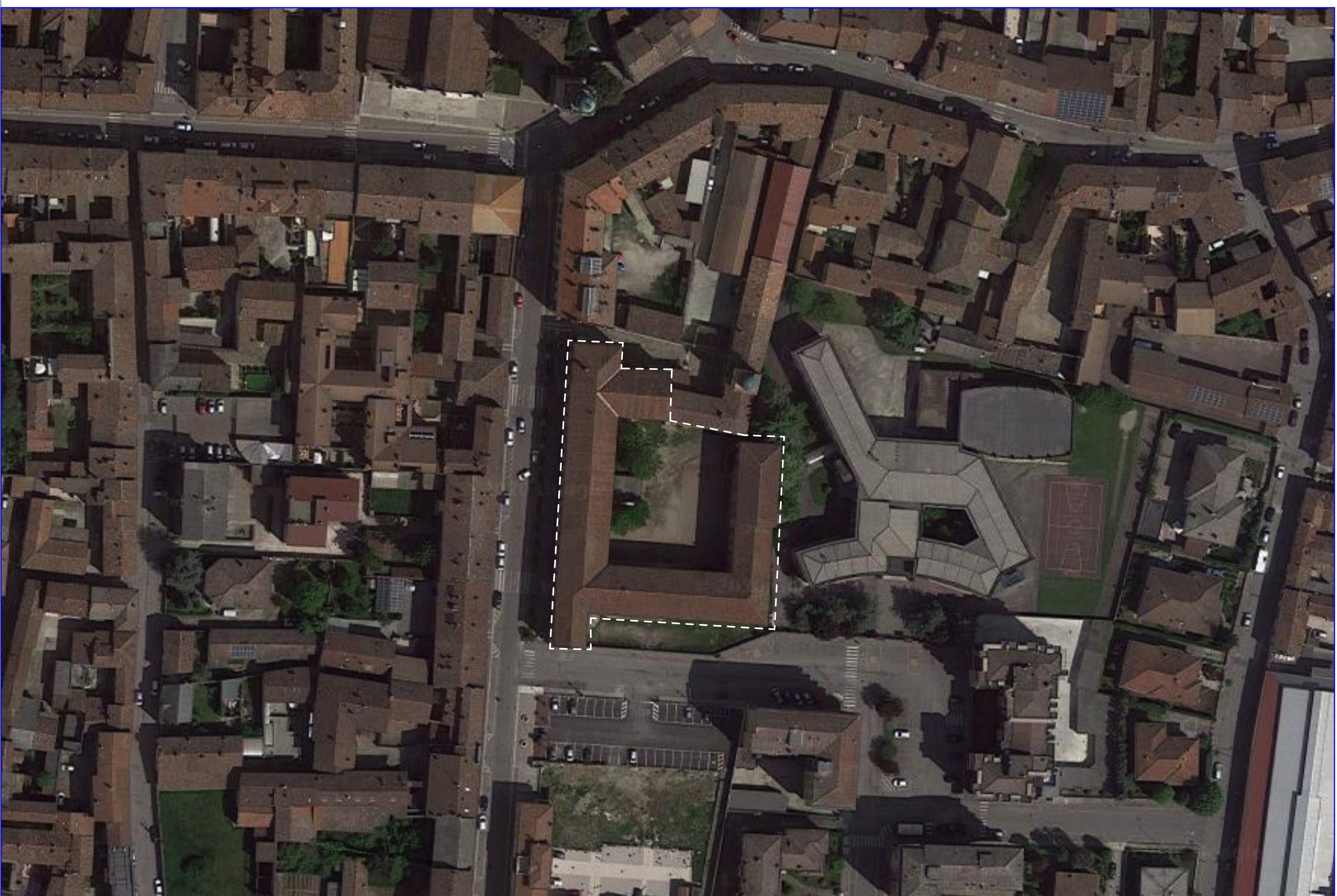
INQUADRAMENTO TERRITORIALE: ORTOFOTO DA GOOGLE_ZOOM SULL'ISTITUTO BERTESI DI SORESINA

Dal testo Soresina 800-900_ Credito Cooperativo Banca di Credito Cooperativo del Cremonese - Casalmorano (Cremona).